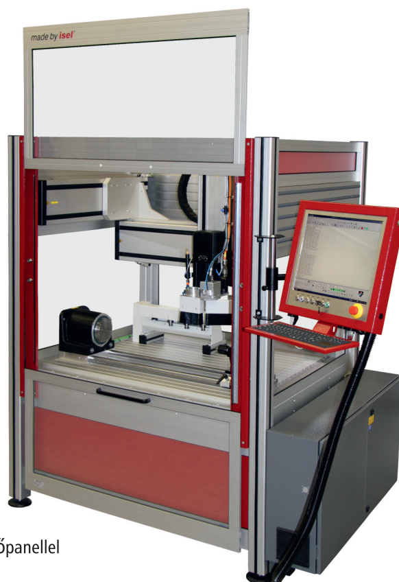
OverHead M40 iOP-19-TFT kezelőpanellel